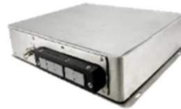
Optional Cable Gland