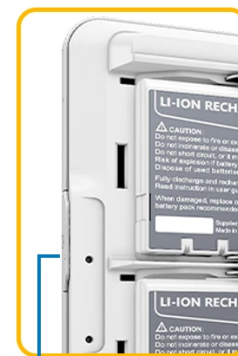
Side: Microphone In Audio Jack USB 2.0 (x2)