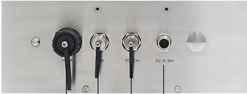
HDMI VGA Touch DC 9~36V